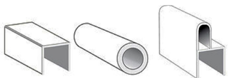
Moulure en U pour mur M-NOR-01 et 09